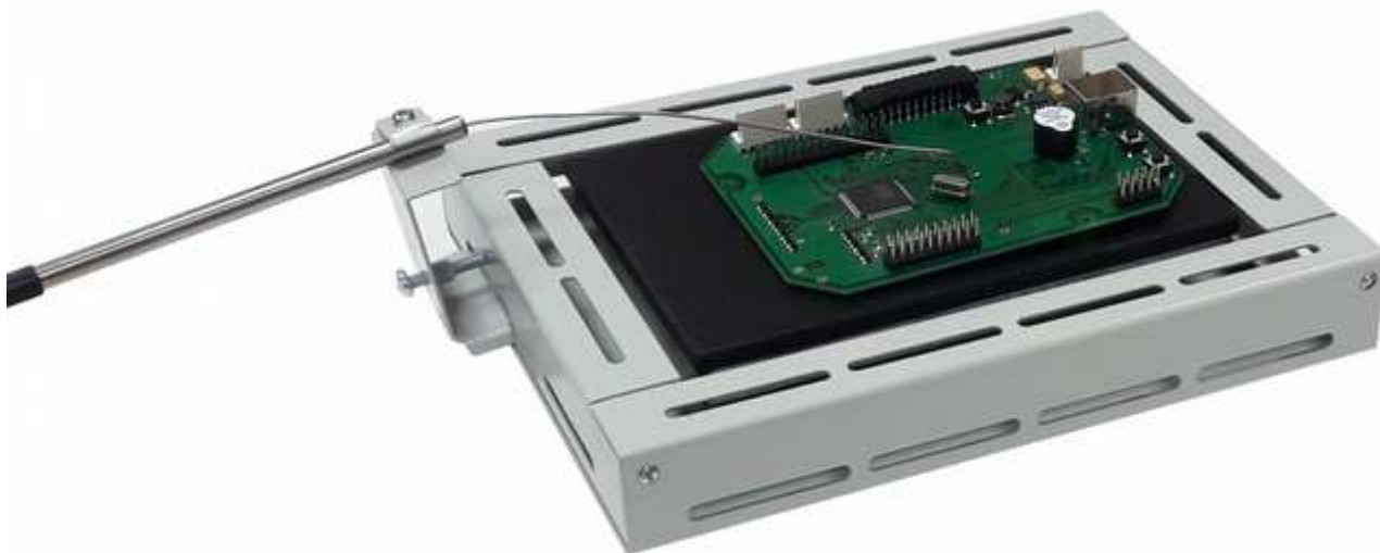
Фото 4. Крепление внешнего термодатчика

некоторый прижимом к ней, за счет пружинных свойств самого термодатчика. После размещения нагреваемых объектов на поверхности термостол и установки внешнего термодатчика, термостол накрывают крышкой, следя за тем, чтобы корпус внешнего термодатчика проходил через один из вырезов крышки.