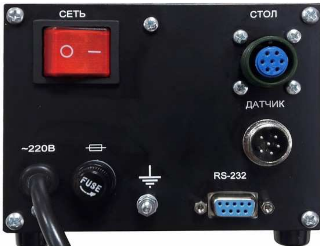
Фото 3. Задняя панель блока управления

Проверьте комплектность станции на соответствие п. 1.4 настоящего РЭ и внешний вид термостола и блока управления на отсутствие механических повреждений.