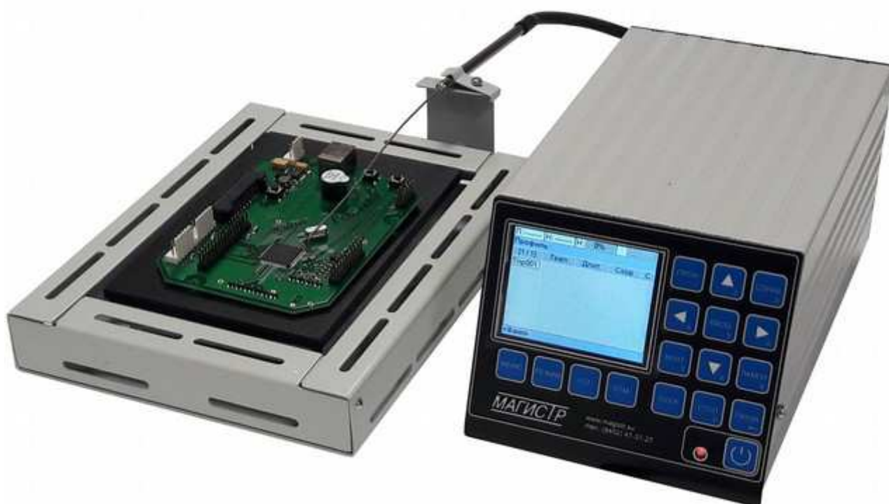
Фото 1. Общий вид станции

Термостол представляет собой плоскую нагревающуюся поверхность, на которой располагают платы либо другие нагреваемые объекты. Термостол имеет места крепления для внешнего термодатчика, который предназначен для контроля температуры в любой точке нагреваемого объекта. Термостол комплектуется крышкой для уменьшения утечки подводимого тепла и обеспечения равномерности нагрева по всему полю стола. Общий вид станции показан на фото 1.