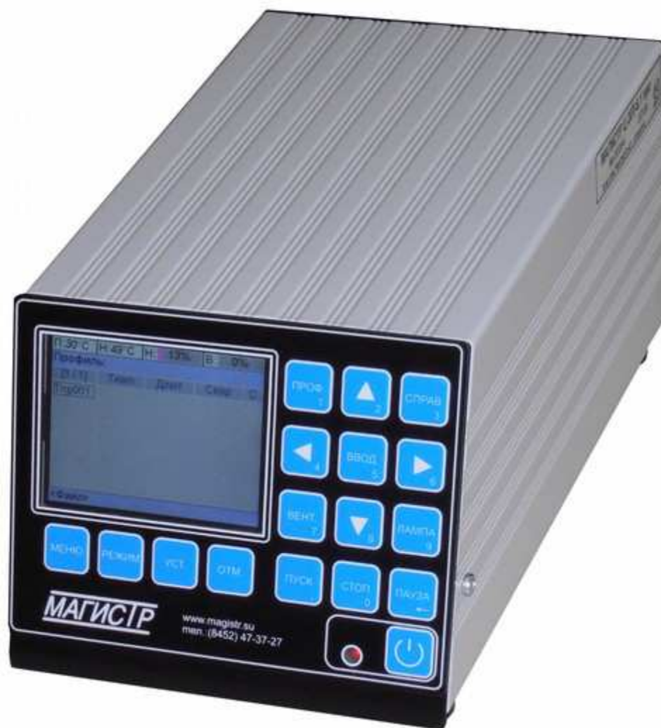
Фото 2. Общий вид блока управления

Термостол и внешний термодатчик при помощи соединительных кабелей подключены к блоку управления. Блок управления считывает показания термодатчиков, управляет мощностью нагрева термостола, а также предоставляет пользователю средства для ввода и редактирования параметров термопрофилей. Конструктивно блок управления выполнен в металлическом корпусе, на задней панели которого расположены клемма заземления, сетевой шнур, сетевой предохранитель, сетевой выключатель, а также соединители для подключения всех остальных элементов станции. На передней панели блока управления расположены ЖК-дисплей, клавиатура и кнопка включения/выключения питания с индикатором питания. Общий вид блока управления показан на фото 2, задняя панель блока управления на фото 3.